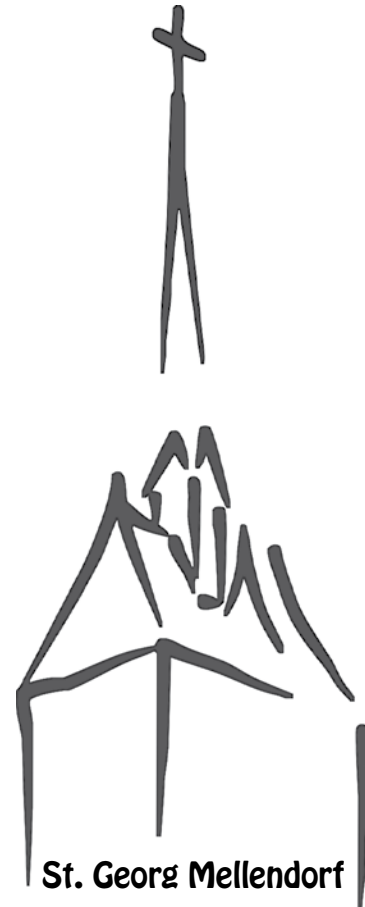
St. Georg Mellendorf