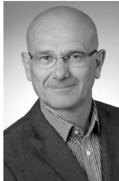
Abb. Holger Grünjes

"wi hebbn visit - wir haben Besuch" heißt es rund um Pfingsten. Der Superintendent des Kirchenkreises Burgwedel-Langenhagen visitiert unsere Kirchengemeinde vom 18. bis 31. Mai . Als Grundlage dieses Besuchs hat der Kirchenvorstand in mehreren Zusammenkünften und mit Unterstützung weiterer nebenamtlicher und ehrenamtlicher Mitarbeiterinnen und Mitarbeiter einen Gemeindebericht erstellt. Dieser Bericht stellt auf 88 Seiten die Ist-Situation der Kirchengemeinde dar. Damit soll Superintendent Grünjes ein Einblick in die Gemeinde Mellendorf/ Hellendorf gegeben werden. Eine gedruckte Fassung dieses Berichtes liegt während der Visitation im Kirchenbüro aus und kann von interessierten Gemeindegliedern eingesehen werden. Nach dieser Vorbereitung, die für den Kirchenvorstand nicht nur bloße Bestandsaufnahme, sondern eine eingehende Reflexion der eigenen Arbeit und die Beschäftigung mit dem eigenen Leitbild war, erhoffen wir uns durch die Gespräche während der Visitation (mit Superintendent Grünjes, Vertretern der Kommune, verschiedenen Einrichtungen und Vereinen und ehrenamtlichen Mitarbeitern) Impulse und Wahrnehmungen, um Perspektiven für die weitere Arbeit und das Leben der Kirchengemeinde im Ort zu entwickeln.