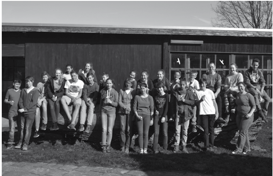
Konfirmandengruppe bei der Freizeit in Bredenbeck im März 2015

Endlich wird es wieder warm, das wollen wir ausnutzen! Wir packen den Grill aus, bringen Kartoffelsalat, Bratwurst und Getränke mit und laden alle Familien zu uns in den Garten hinterm Gemeindehaus ein. Wir wollen gemeinsam Spiele spielen, singen, uns unterhalten und uns das Gegrillte schmecken lassen.