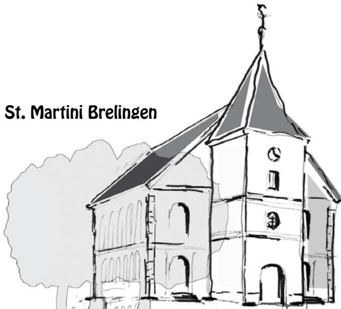
St. Martini Brelingen

„Alles vermag ich durch Gott, der mir Kraft gibt.“ (Philipper 4,13 )